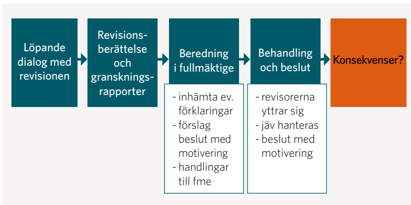
Figur 1: De olika momenten i ansvarsprövningsprocessen