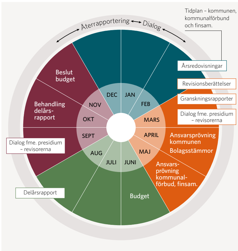
Figur 2: Exempel på en årlig tidplan i fullmäktige för ansvarsprövningsprocessen, dialog och återrapportering samt några andra viktiga beslutspunkter

dialog med revisorerna och återrapporteringar i fullmäktige från styrelse, nämnder, beredningar, förbund och företag. En tydlig årsplan för alla dessa aktiviteter ger alla parter ett bra underlag för sin planering och möjlighet att anlägga en helhetssyn på styrning, uppföljning, granskning och ansvarsprövning.